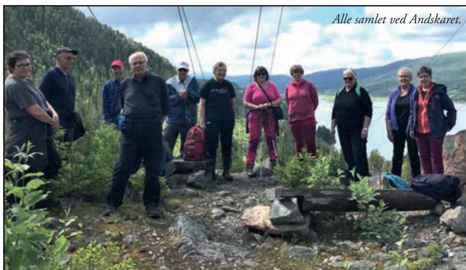
Alle samlet ved Andskaret.