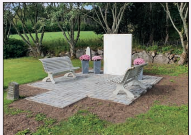
Den nye minnelunden på Løvøya.