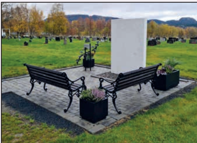
Den nye minnelunden på Statland.